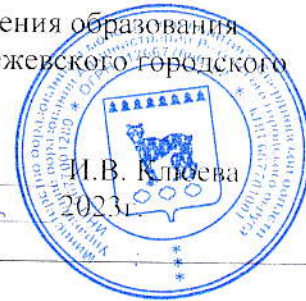
График направления работников муниципальных образовательных организаций Режевского городского округа, в которых действуют ППО Общероссийского Профсоюза образования, в ГАУ СО «Профилакторий «Юбилейный» на II-IV кварталы 2023 год