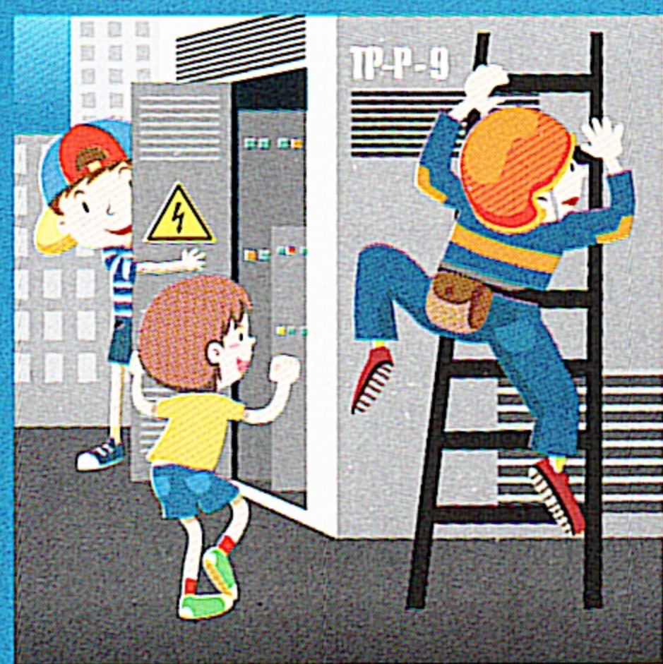
Нельзя открывать двери трансформаторных подстанций!