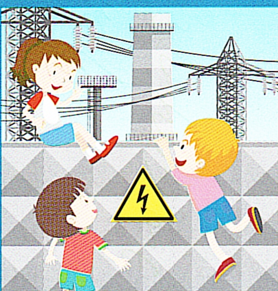
Не придумывай как достать или проникнуть! Позови взрослых!