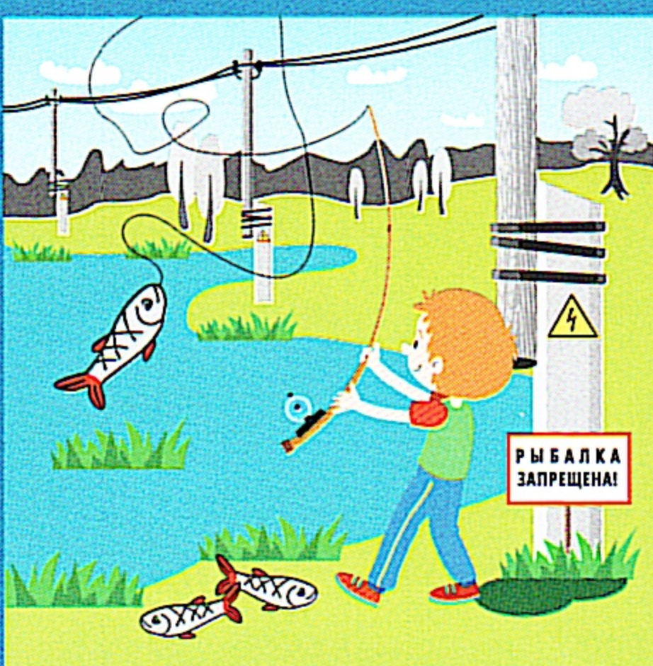
Нельзя ловить рыбу рядом с линией электропередачи!