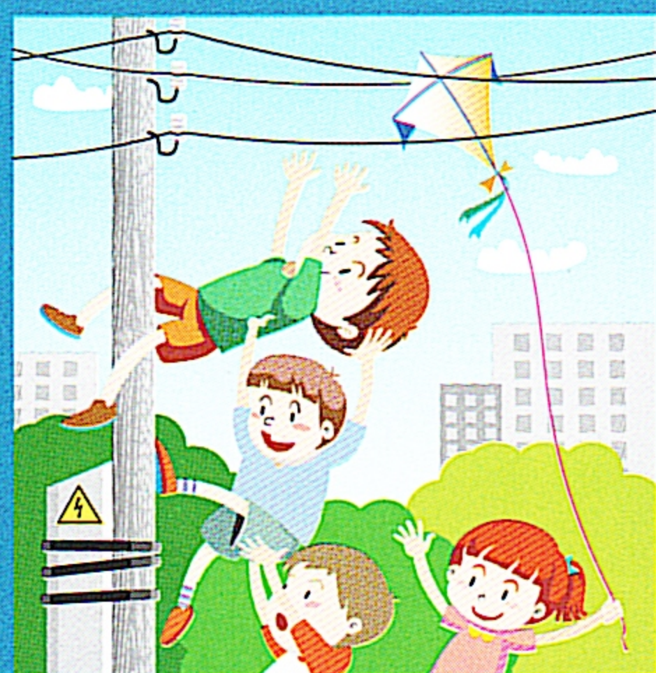
Нельзя играть вблизи линий электропередачи!