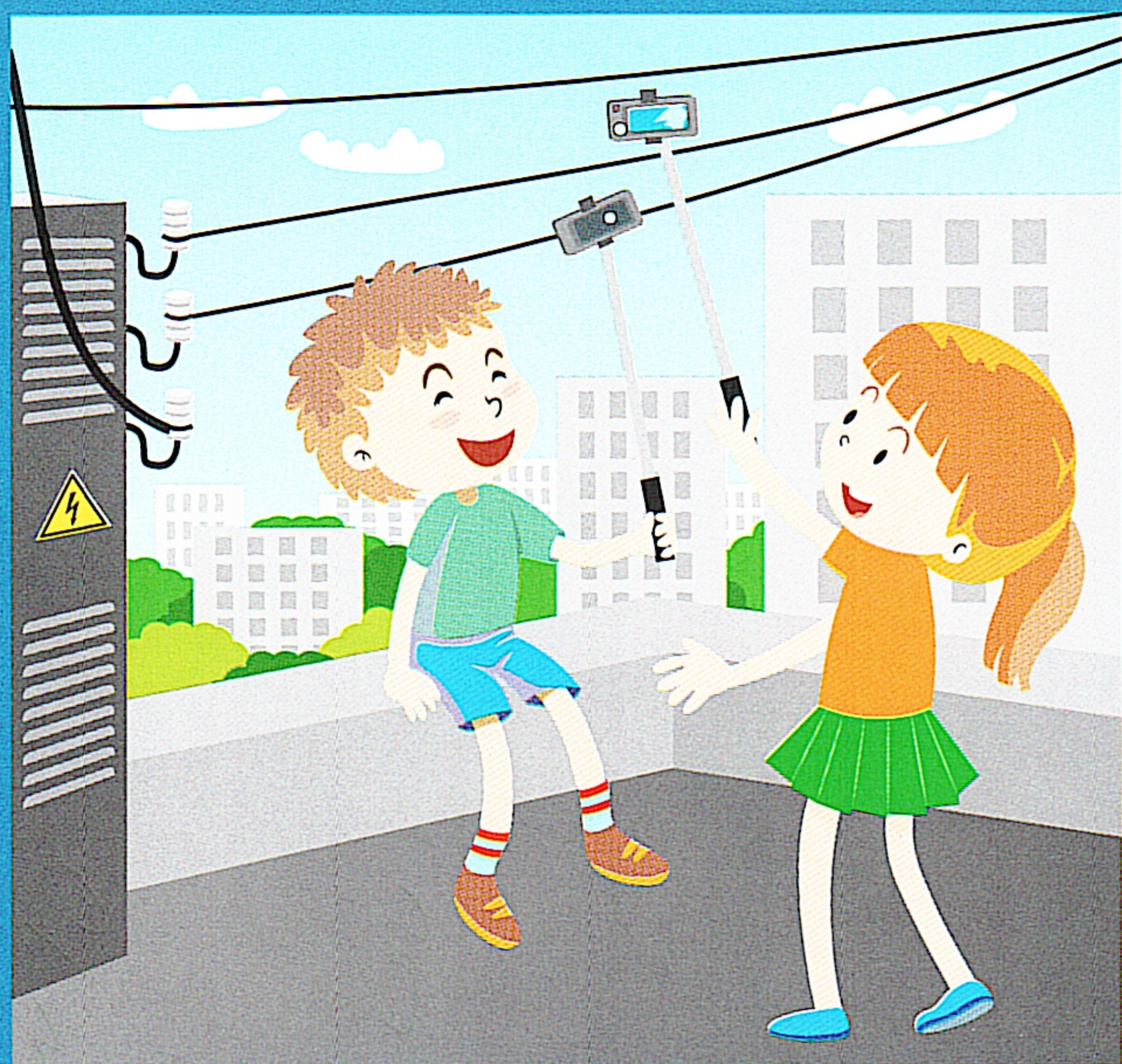
Нельзя использовать палку для селфи рядом с электрооборудованием и линиями электропередачи!

Обращаем ваше внимание на необходимость соблюдения правил поведения вблизи энергообъектов! Линии электропередачи и иные электроустановки – источник повышенной опасности! В зоне риска – наши дети! Энергетики убедительно просят вас, уделите пять минут и прочитайте вместе со своими детьми основные правила электробезопасности!